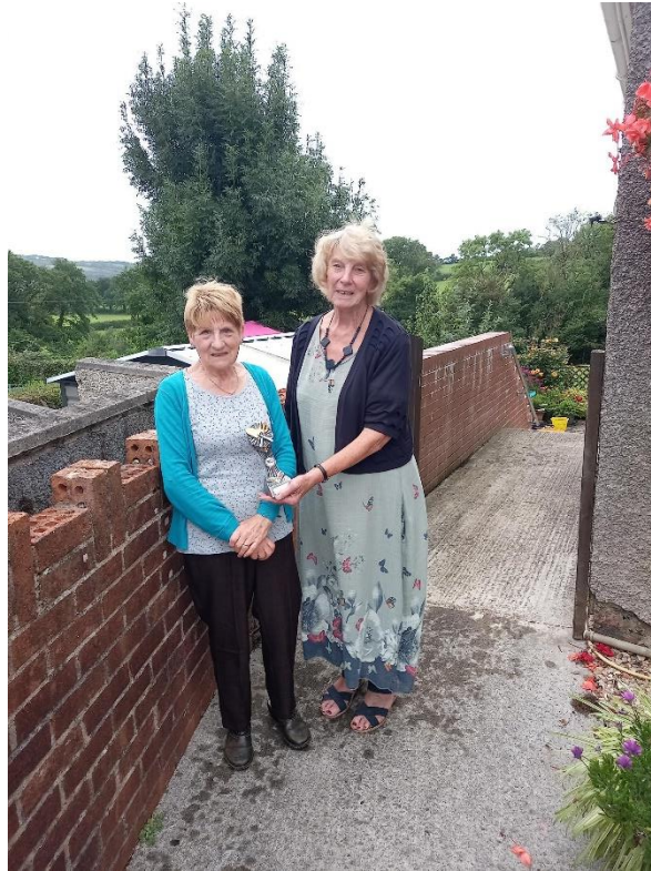
Best Small Flower Garden, 3 Bro Pedr, Llandyfaelog