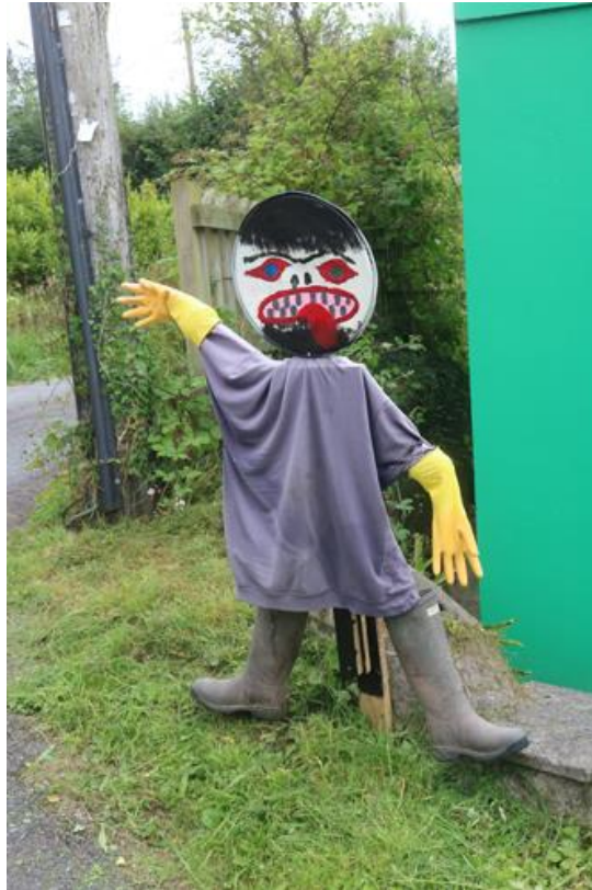
Nant yr Arian, Pentrepoeth