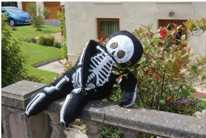
Beili Glas, Upland Arms