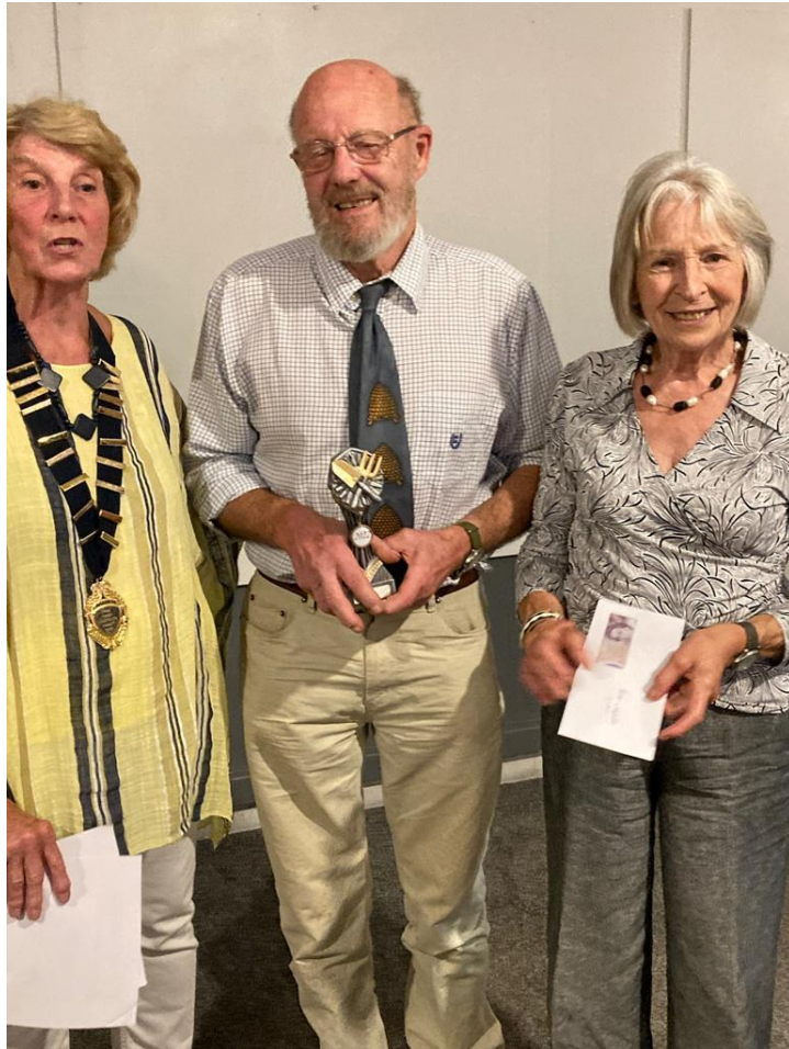
Best Vegetable Garden – Cwmburry Honey Farm