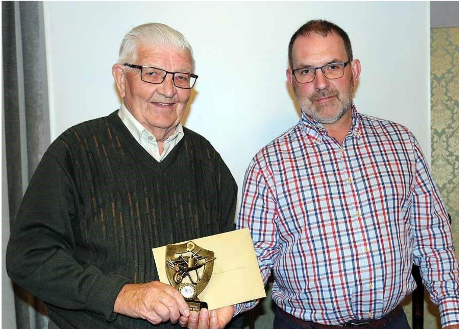
Llygaid yr Efail, Upland Arms