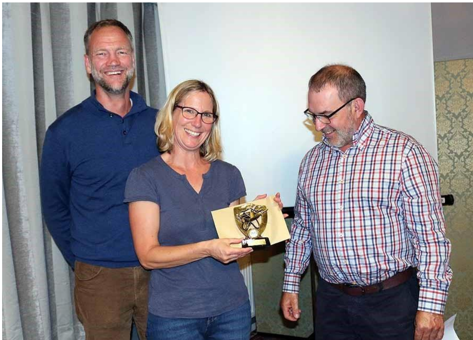
Ysgubor Hen, Llandyfaelog