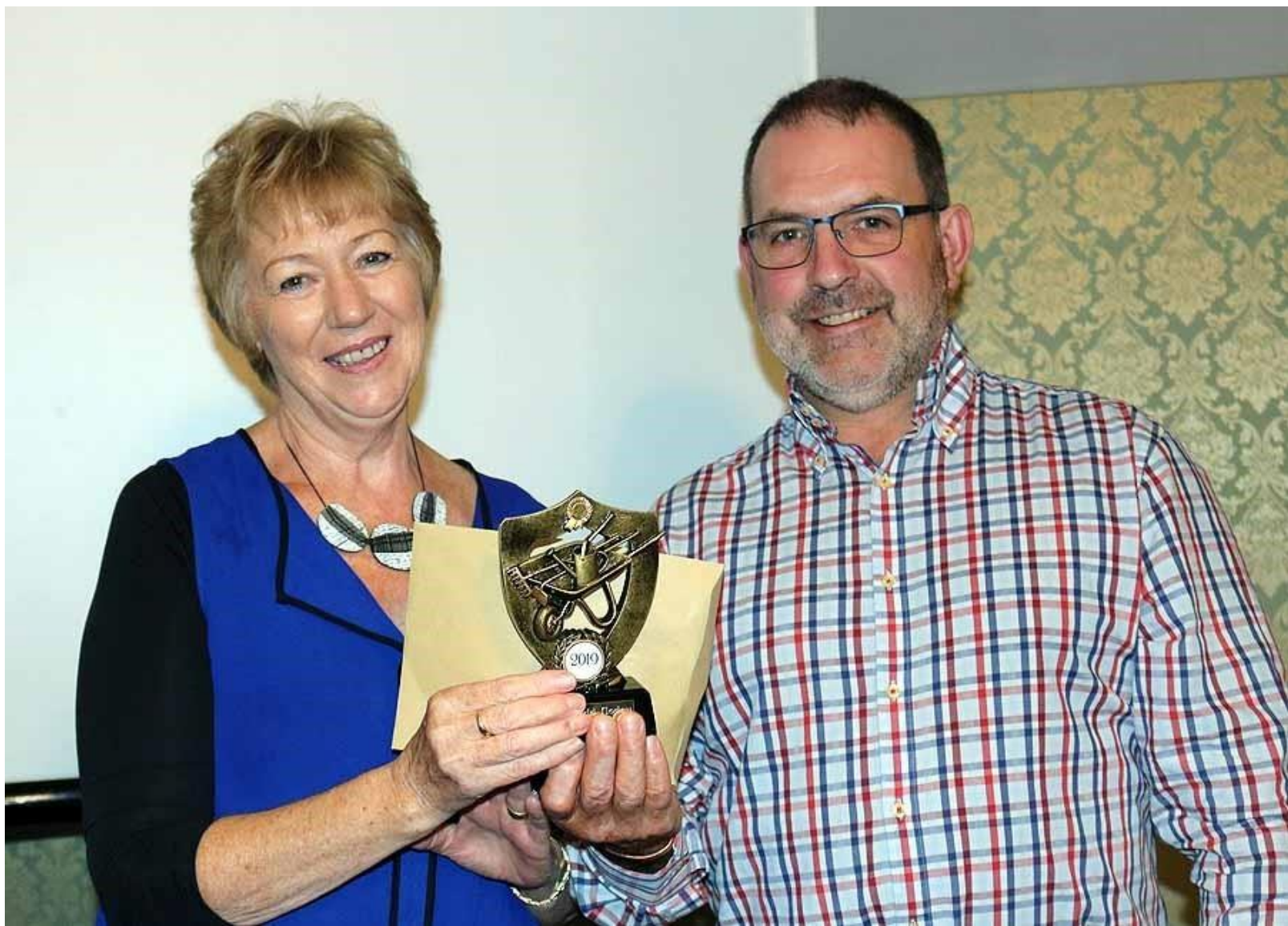
Ael y Fro, Cwmffrwd