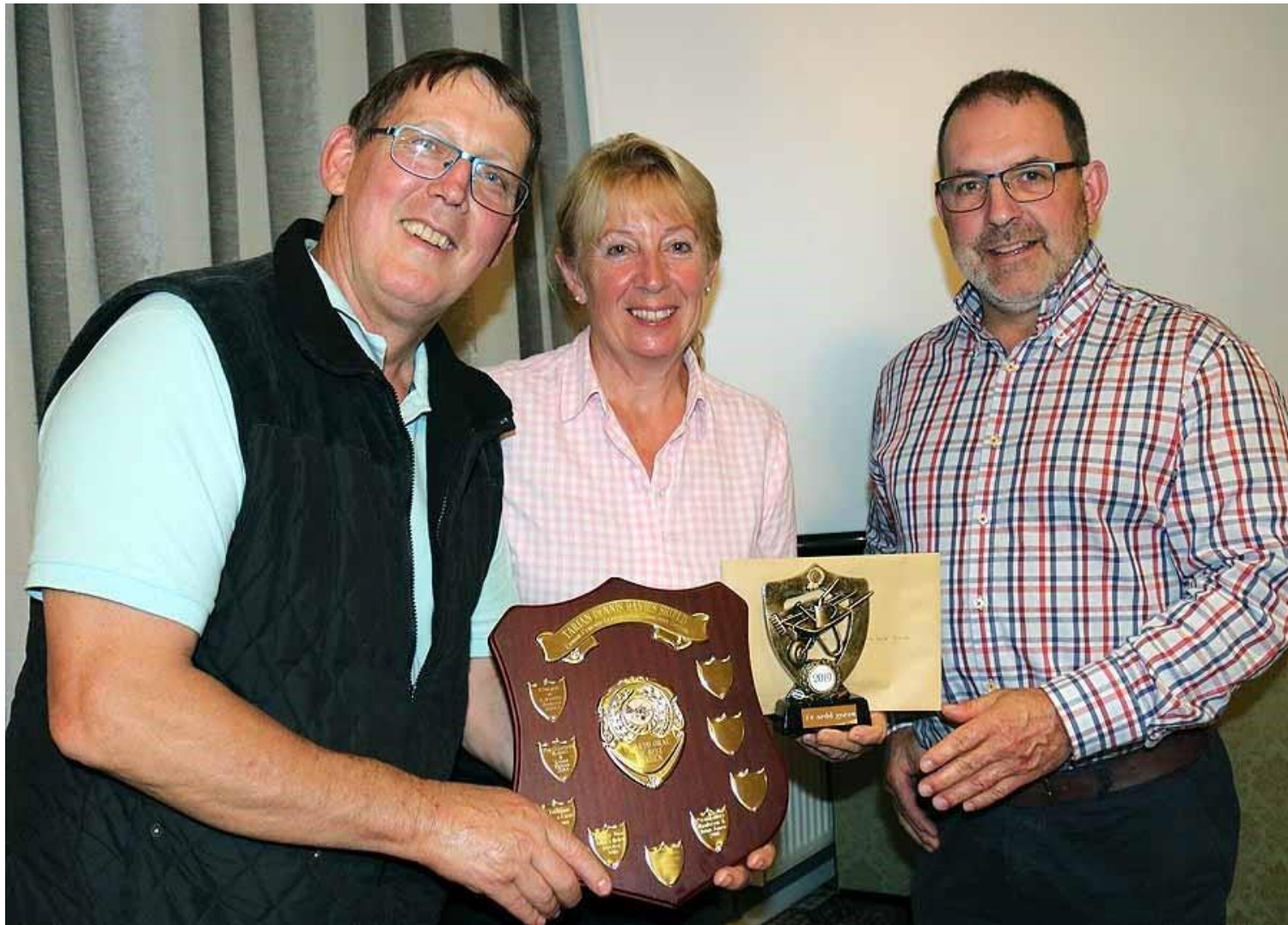
Fforest Uchaf, Pontantwn